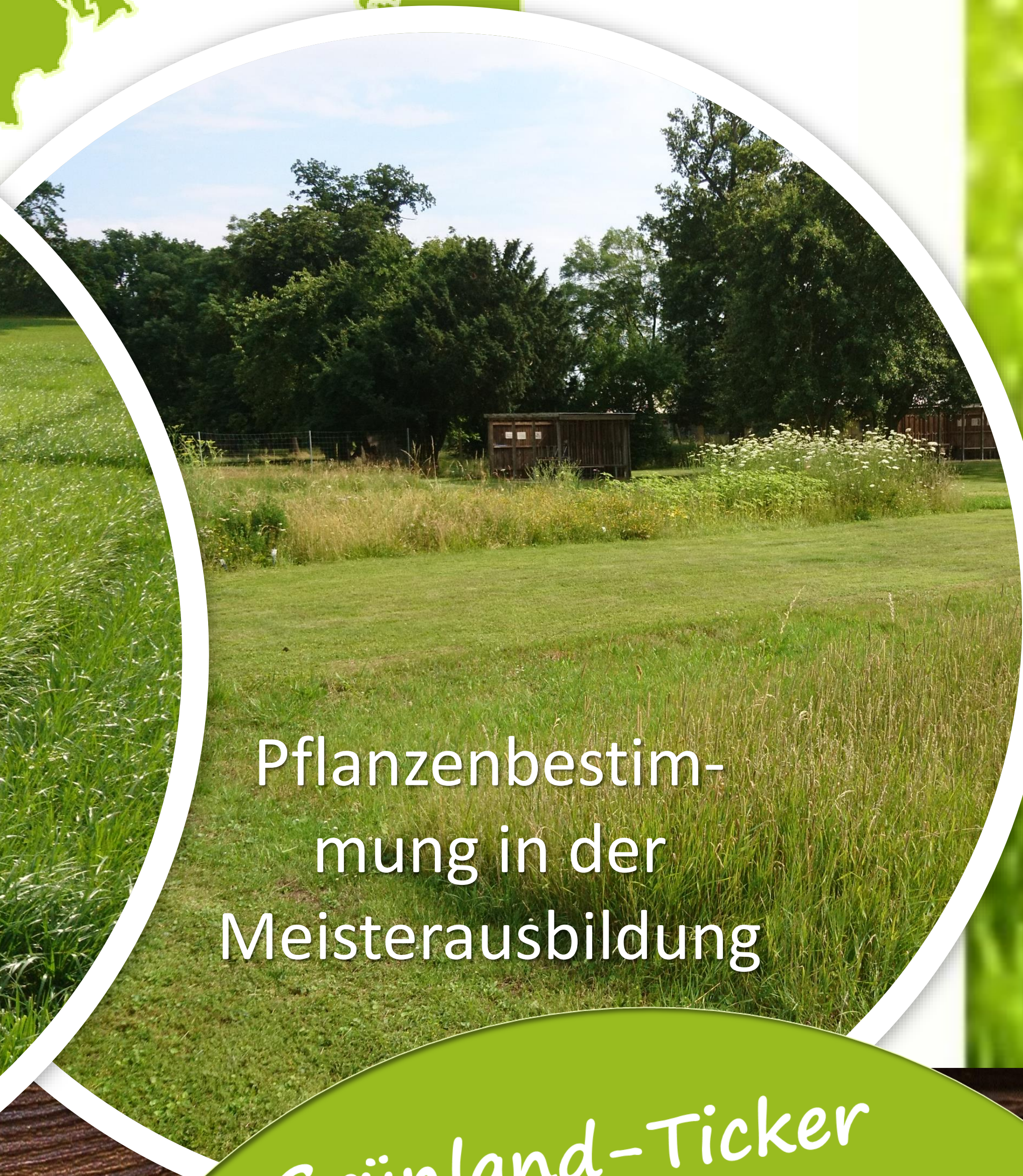
Pflanzenbestimmung in der Meisterausbildung

Soutenu par le Ministère de l'Agriculture, de la Viticulture et du Développement rural du Grand-Duché de Luxembourg