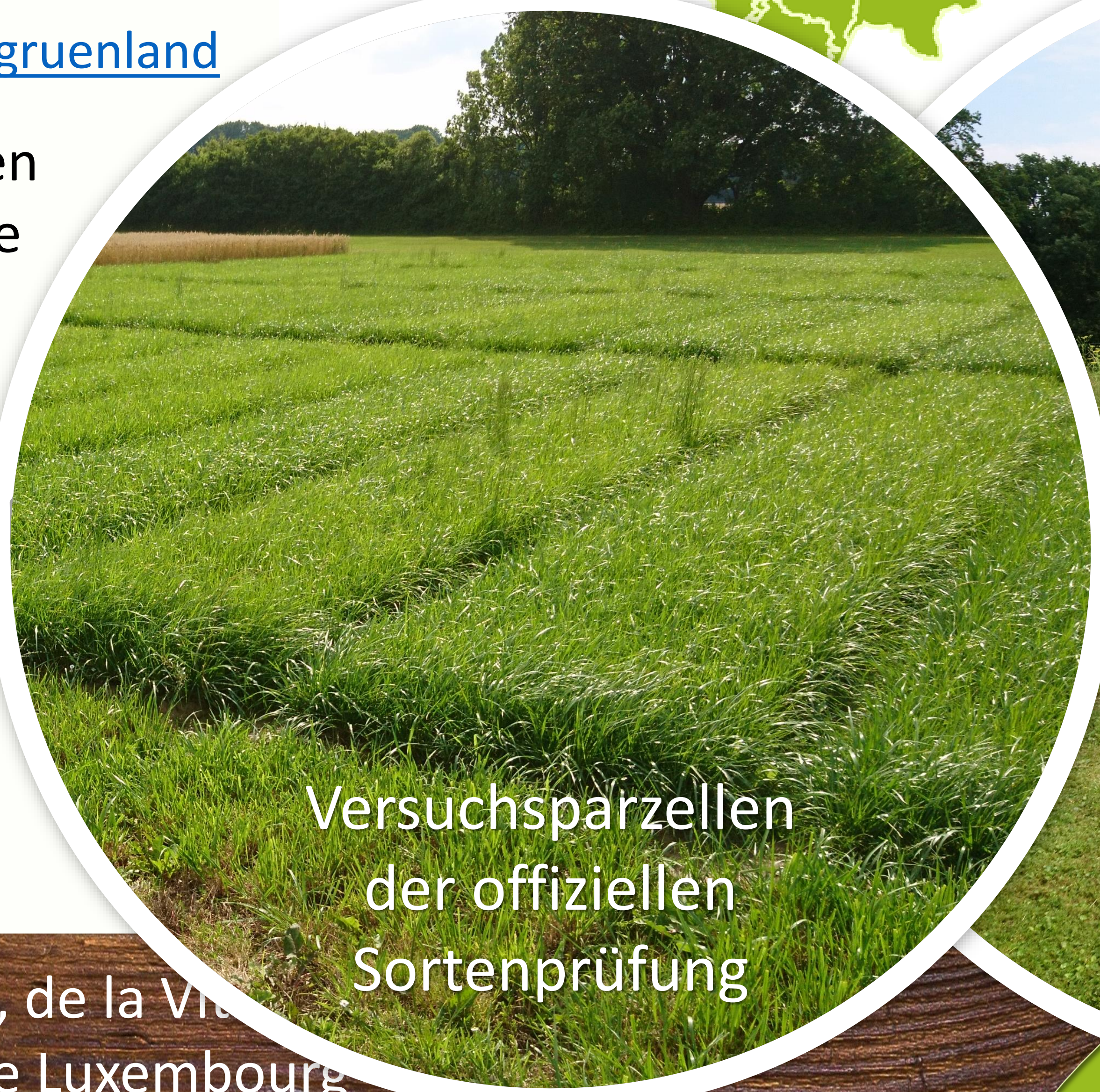
Versuchspärzellen der offiziellen Sortenprüfung