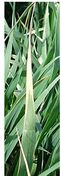
Vertrocknete Blattspitze im Winterweizen.

Der Winterweizen befand sich am 2. Mai 2017 am Standort Burmerange im Süden im Wachstumsstadium 34, im Gutland (Standorte Everlange und Bettendorf) am Ende des Wachstumsstadiums 31 und im Ösling (Standort Reuler) im Stadium 31. Die Trockenheit im April hat die Entwicklung feuchteabhängiger Pilzkrankheiten weitgehend unterbunden. Stellenweise kann man vergilbte Blattspitzen finden (siehe Abbildung rechts). Auf den vergilbten Blattspitzen sind keine Anzeichen von Schadpilzen wie Myzel oder Fruchtkörper zu finden. Dieses Schadbild lässt sich nicht mit Fungiziden bekämpfen und könnte von der mehrwöchigen Trockenheit im April hervorgerufen worden sein. Im Winterweizen sind auf den Versuchsstandorten aktuell kaum Krankheiten zu finden. Im Moment sind auf den Versuchsstandorten im Winterweizen keine Fungizidanwendungen notwendig.