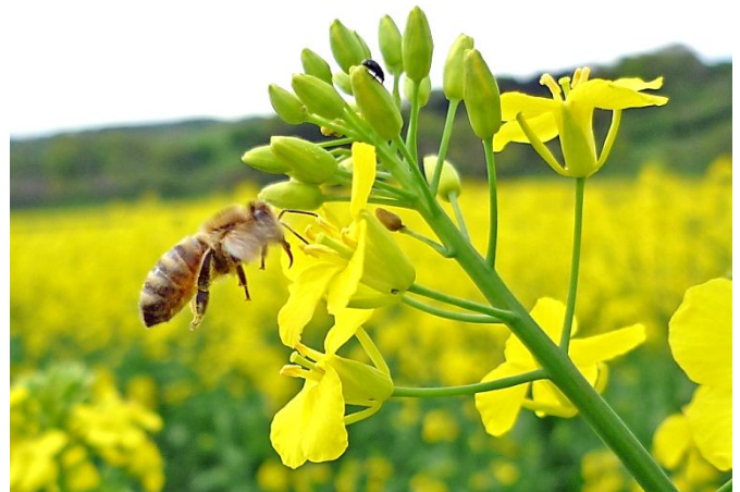
Bild 7: Abdrift von Insektiziden auf blühende Pflanzen am Feldrand unbedingt vermeiden.