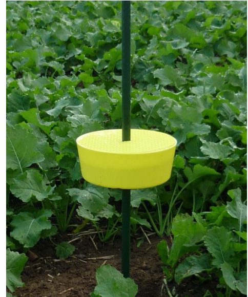
Bild 2: Die Gelbschale dient zur Erfassung des Schädlingzufluges.