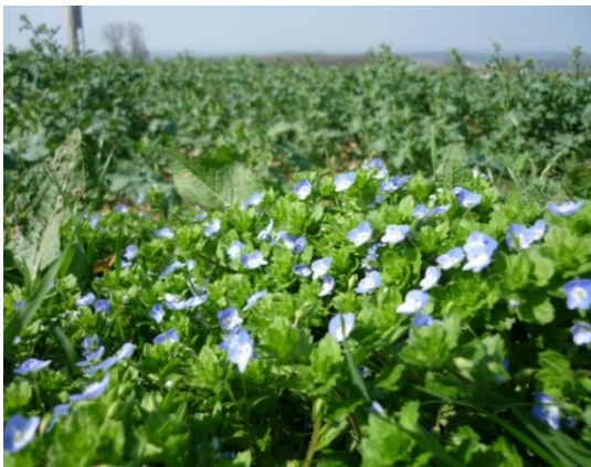
Bild 5: Ehrenpreis blüht im Rapsbestand. Eine Anwendung von Insektiziden mit der Bienenschutzauflage B1 ist hier nicht zulässig.