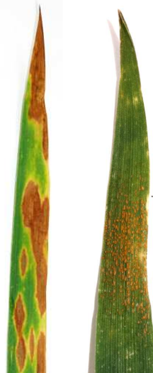
Bild 1: Blattdürre (links) und Gelbrost (rechts) an Winterweizen.

Bis zum Jahr 2013 war die Blattdürre, ausgelöst durch den Pilz Zymoseptoria tritici (Bild 1), die schädlichste Krankheit in den Getreidebeständen, insbesondere im Winterweizen. Seit 2013 hat der Gelbrost, ausgelöst durch Puccinia striiformis (Bild 1), die Blattdürre als schädlichste Krankheit abgelöst.