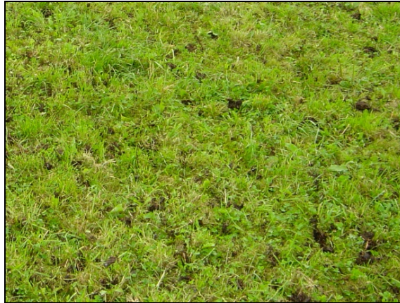
Abbildung 4: Im Herbst auf eine Wiese ausgebrachter Mistkompost (20 t pro ha).