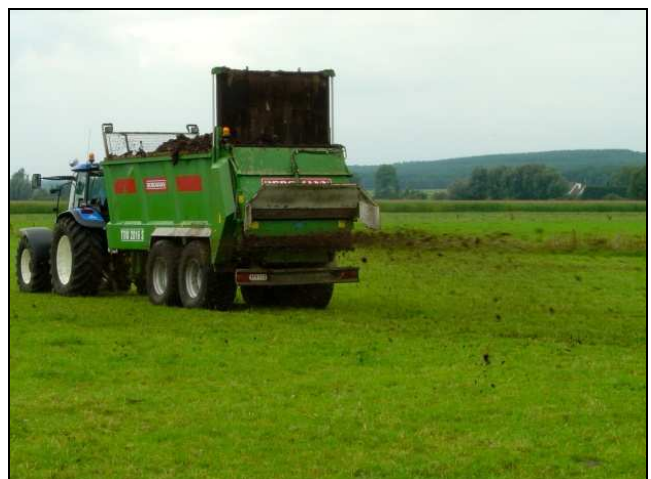
Abbildung 2&3: Umsetzung einer Mistmiete und Ausbringung von Mistkompost. Neben allen agronomischen und biologischen Vorteilen, die die Kompostierung gewährleistet, erlaubt die zerkrümelte Struktur von Mistkompost eine wesentlich bessere Verteilung auf Dauergrünlandparzellen als Mist. Die vergleichsweise schlechtere Verteilung des Mistes führt zu Lückenbildung, da die Mistklumpen die Grasnarbe teilweise zudecken und schädigen.

Das C/N-Verhältnis ist entscheidend für den Kompostierungsprozeß – es sollte über 20 liegen, nur so sind Sickersaftverluste und folglich Verluste an Stickstoff und Kali zu vermeiden. Anfallender Mist aus den Laufgängen eines Tretmiststalles besitzt meistens ein zu geringes C/N-Verhältnis, solcher aus dem Tiefstreubereich hingegen erweist sich als optimal. Das C/N-