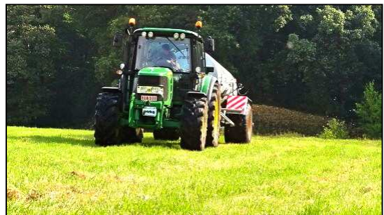
Abbildung 1: Unter Berücksichtigung von pflanzenbaulichen und umweltrelevanten Aspekten kann im Herbst eine dem Zeitpunkt angepasste Gölledüngung auf Dauergrünland sicherlich sinnvoll sein.

gilt: Je später im Herbst die Güllegabe, umso besser ist die Stickstoffausnutzung und umso niedriger sind die Verluste. Denn gelingt es, die Gölledüngung in geringen Mengen erst kurz vor Vegetationsruhe auszubringen, so ist die Stickstoffaufnahme durch die Grünlandpflanzen in der Regel sehr gering und trotzdem werden kaum Auswaschungsverluste zu verzeichnen sein. Dies läßt sich dadurch erklären, daß das Ammonium aus der Gülle aufgrund der meist kälteren Bodentemperaturen nicht mehr zu leicht löslichem Nitrat umgewandelt werden kann. Somit werden Reserven an Göllestickstoff geschaffen, die bis zum Zeitpunkt des Pflanzenverbrauchs im nächsten Frühjahr im Boden gelagert werden. Die Witterung ist ebenso entscheidend: bei bedecktem Himmel, leichtem Nieselregen und/oder niedrigen Temperaturen sind die Stickstoffverluste durch Verflüchtigung des Ammoniaks minimal.